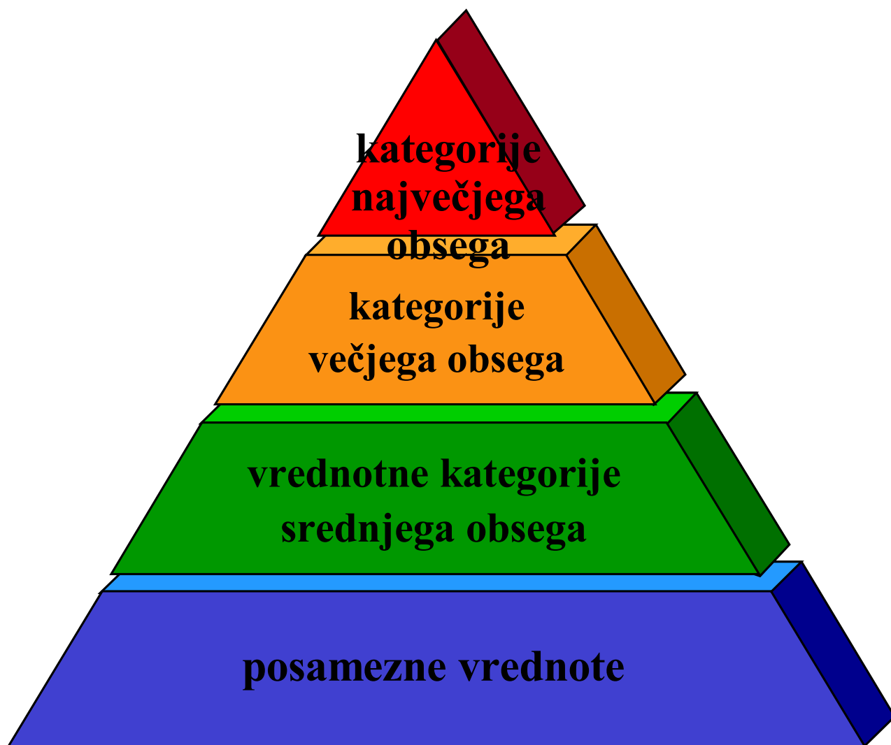
Slika 3. Hierarhična struktura vrednot in vrednotnih kategorij.